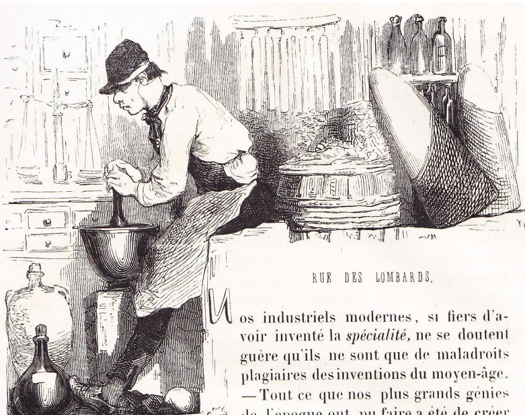
RUE DES LOMBARDS.

nos industriels modernes, si fiers d'avoir inventé la spécialité , ne se doutent guère qu'ils ne sont que de maladroits plagiaires des inventions du moyen-âge. — Tout ce que nos plus grands génies de l'époque ont pu faire a été de créer des boutiques spéciales pour vendre des chemises ou des gilets de flanelle, tandis qu'il y a trois ou quatre cents ans, la spécialité brillait dans tout son éclat et dans toutes les branches du commerce parisien.